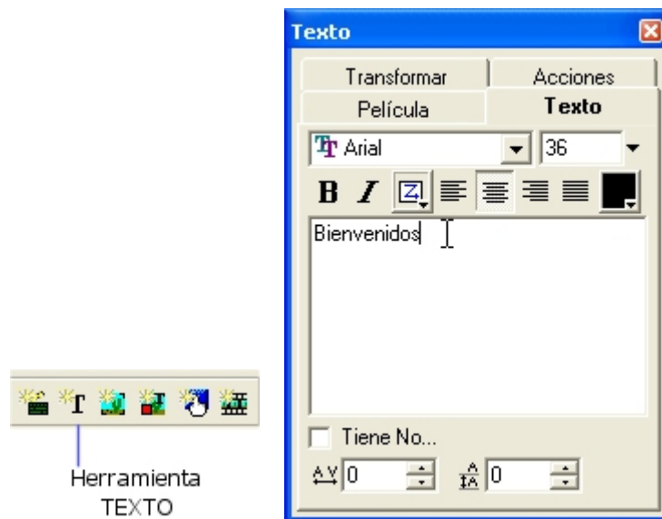
Figura 12.1 Botón Texto para insertar un cuadro