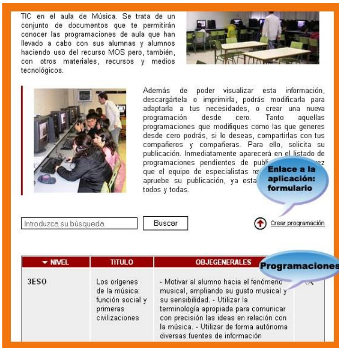
Ilustración 7: Pantalla de la aplicación “Programaciones de aula”