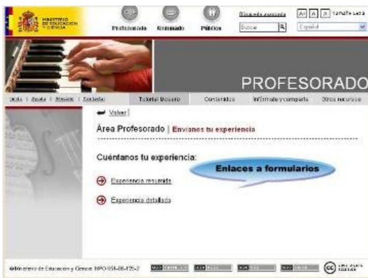
Ilustración 2: Pantalla de enlace a los formularios