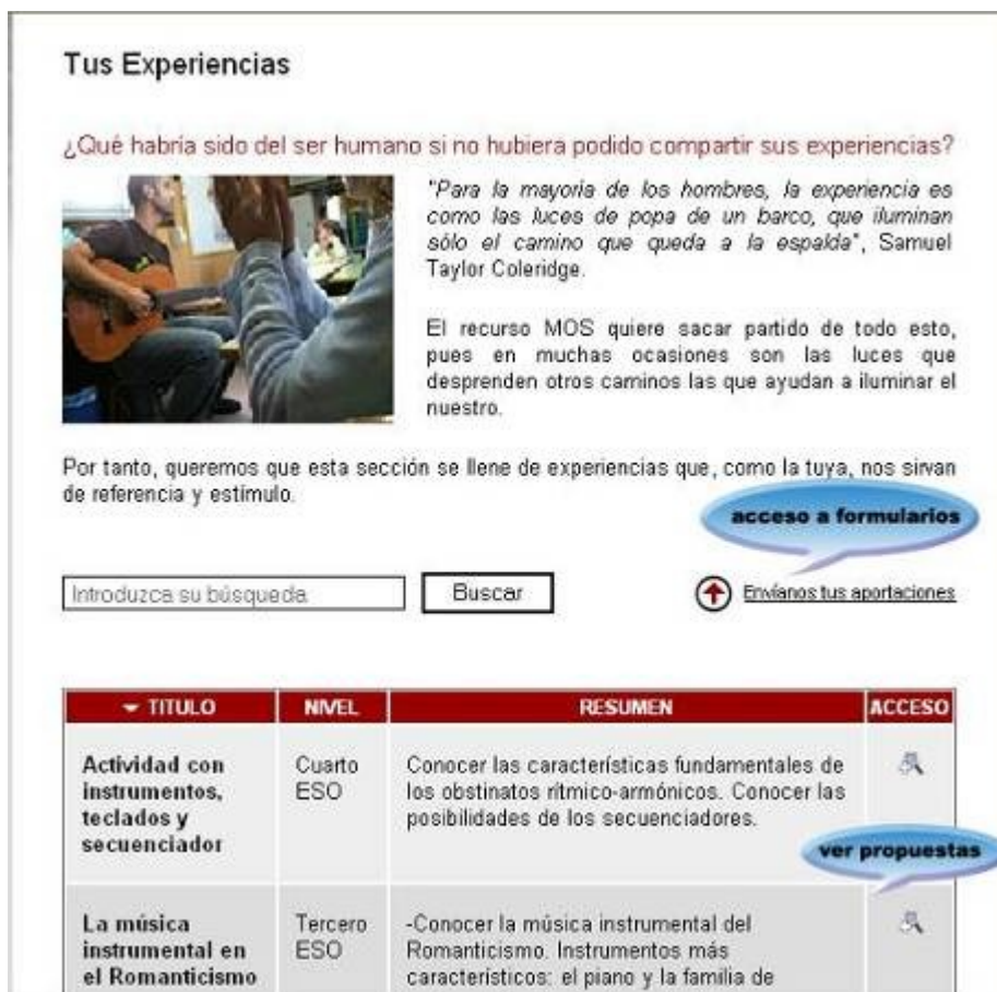
Ilustración 1: Pantalla inicial de la sección Experiencias